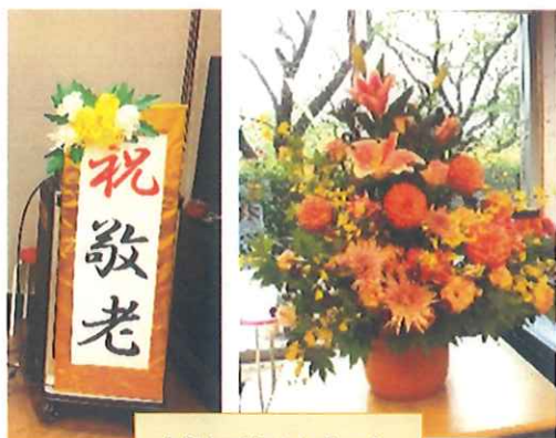
素敵な看板とお花です