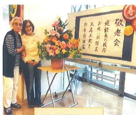
仲良く記念撮影です