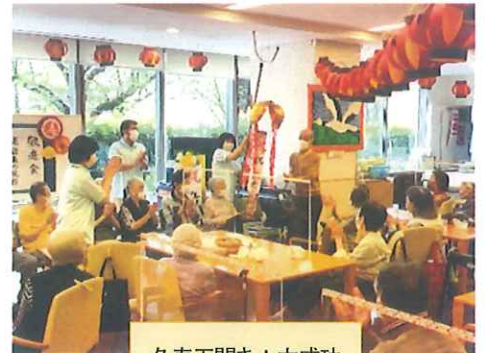
久寿玉開き！大成功