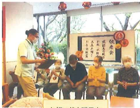
お祝い状を贈呈中