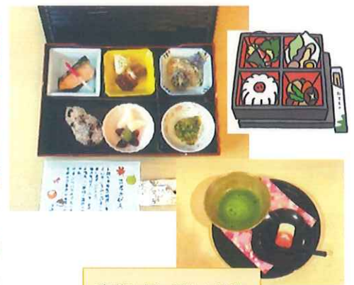
豪華お祝い膳とお抹茶