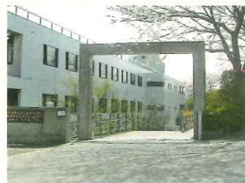
法人本部・いなぎ正吉苑 (東京都稲城市)

正吉福祉会は昭和 60 年に東京都稲城市で創設され、現在都内・神奈川県内に 18 拠点 95 事業を運営、高齢者福祉サービスの事業発展を行っています。当法人は人間の尊厳と自己実現を理念とし、ご自分が望む生活が継続できるように支援するとともに、地域福祉の進展に寄与することを目指しています。しもいぐさ正吉苑においても、理念に基づき、培ってきたノウハウを活かしながら、皆さまが自分らしく自立した生活が送れるよう支援いたします。