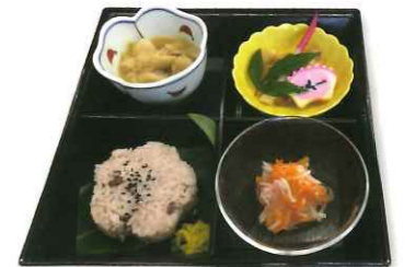
おせち料理（お正月）