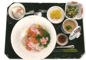
ちらし寿司（ひな祭り）

昼食は、旬の食材を取り入れ、栄養のバランスがとれた見て美しく食べておいしいお食事をご提供いたします。身体状況や栄養嗜好などを考慮したメニューでご利用者さまの健康保持に努めます。また、季節・行事に合ったイベント食も用意しています。