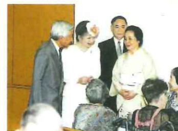
上皇天皇后両陛下いなぎ正吉苑へ行幸啓 (平成 13 年)

正吉福祉会 WEB サイト https://www.shoukichi.org/