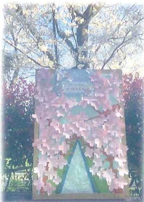
今年の開花予想ボードも満開です！！

今年も恒例の“桜の開花予想”をしました！例年より平均気温が高く、皆様 悩みに悩んで予想されていましたが、見事開花を当てた方は過去最多の 11 名でした！（正吉苑の標準木は【3月20日】に開花しました。）晴れた日は屋外でおしゃべりしながら桜を楽しみました。曇天も続きましたが、その分長めに観賞できた今年のお花見でした。