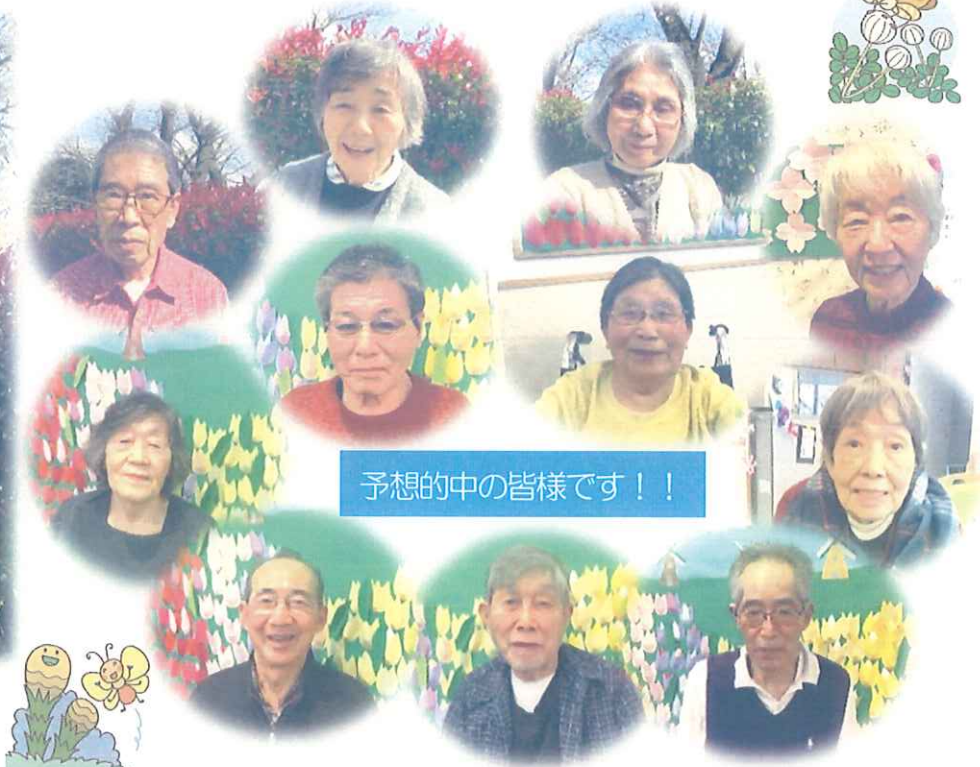
予想的中の皆様です！！